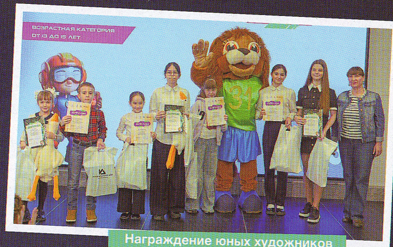
Награждение юных художников