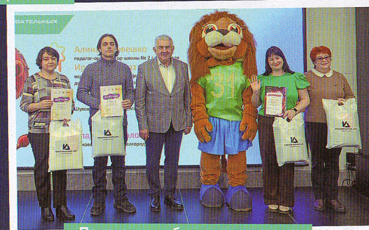
Педагоги – победители конкурса