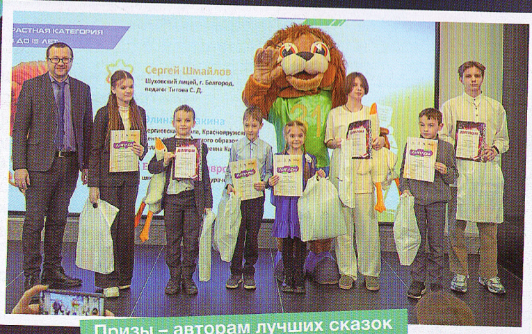
Призы – авторам лучших сказок