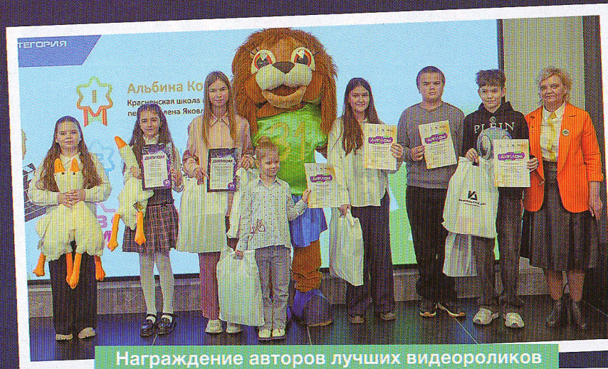
Награждение авторов лучших видеороликов