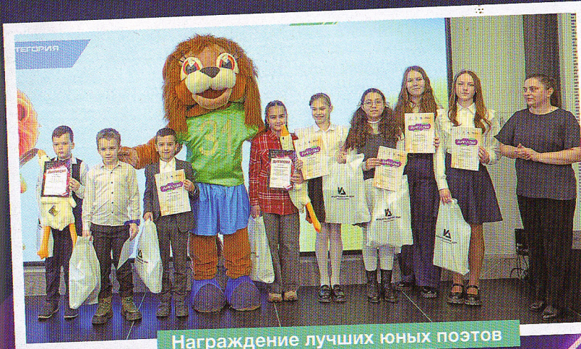
Награждение лучших юных поэтов