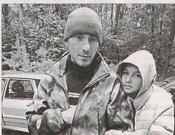
Проводы мужа и отца на СВО в парке «Маршалково». Этот день останется в памяти надолго как самого защитника, так и его девочку.

лучшего, но глава семьи не сдаётся. В планах у него заняться собственным малым бизнесом, связанным с шиномонтажом.