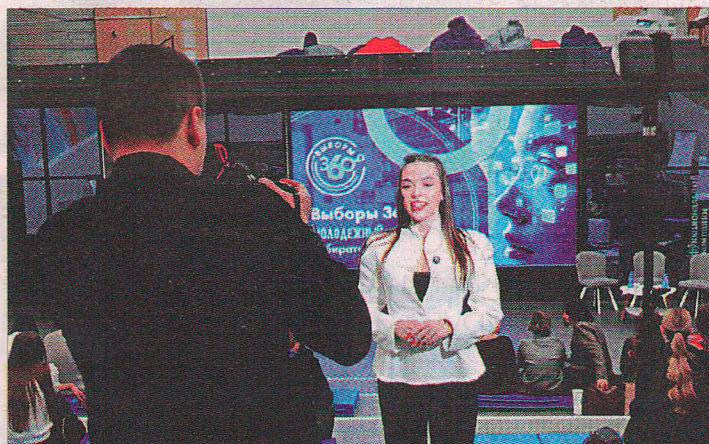
Автором проекта «Выборы 360» стала Виктория Ямпольская.

и поддержка избирательной активности молодёжи региона. Для этого по всей области пройдут встречи с представителями молодёжных активов, где ребята смогут повысить правовую грамотность и пообщаться с опытными наставниками.