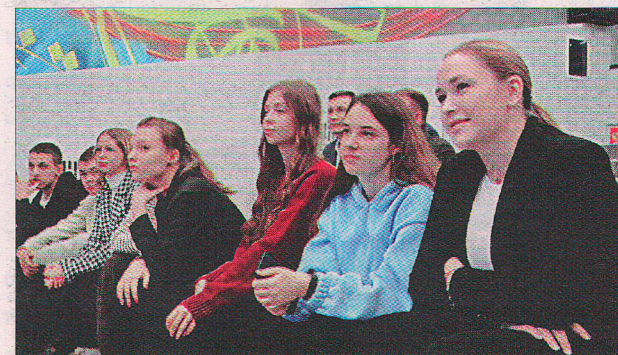
Команда яковлевской молодёжи показала высокий уровень осведомлённости в области избирательного права.