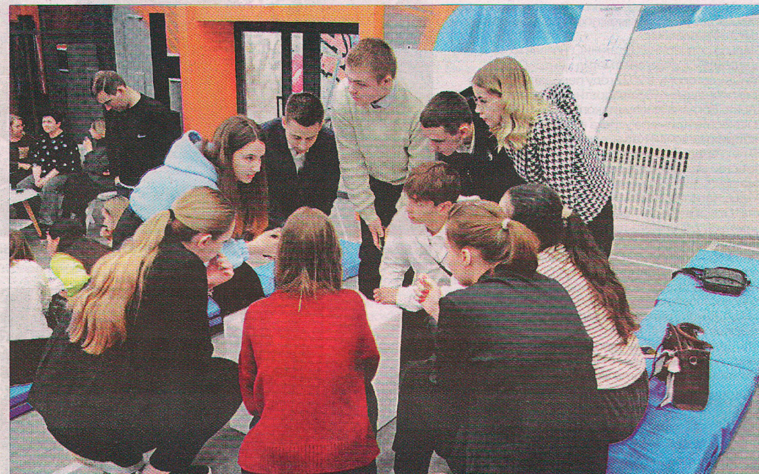
Такой формат реализации проекта нашёл положительный отклик у молодёжи региона.