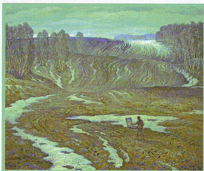
Лев Блякницкий. «Весна под Прохоровкой»

Лев Блякницкий (1926–2007) – художник-фронтовик с удивительной, трагической и героической биографией. Его картина «Весна под Прохоровкой» – произведение особенное, само название отсылает к месту, ставшему символом величайшей трагедии и величайшей славы. На панно мы видим поле с ещё не сошедшим до конца пятнистым снегом. Из талой, влажной земли уже пробиваются первые подснежники. Извилистый поток тающего снега, словно живой, разрезает поле. И в центре этой пробуждающейся, ещё по-весеннему суровой природы стоит фигура художника с мольбертом. Он пытается запечатлеть этот момент. Весна здесь не только время года, но и символ вечного обновления жизни на земле, политой кровью предков.