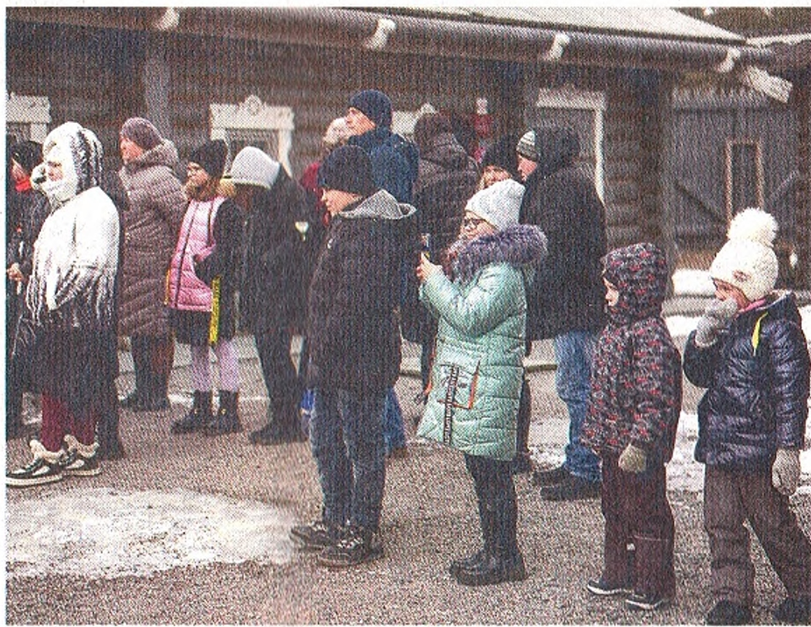
◀ Зрители перенеслись на несколько столетий назад и стали свидетелями виртуозных выступлений казаков

— Первоочередное — хотелось бы запустить таверну рядом с крепостью, — отметила она. — Рядом с центром — лесной массив в форме сердца. Когда к нам приходят посетители, мы обращаем на это внимание. Хотелось бы организовать какие-то прогулочные зоны, беседочки, чтобы люди семьями могли проводить там время, потому что сюда приезжают практически на целый день. Это планы на перспективу. Я всегда говорю, что все дороги теперь ведут не в Рим, а в город-крепость «Яблонов».