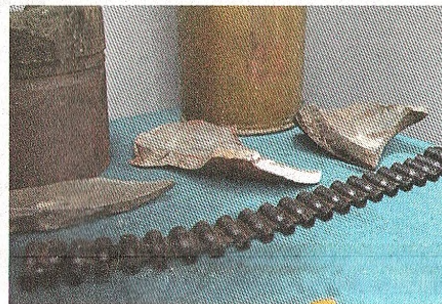
В экспозиции представлены фрагменты осколков от снарядов и детали оружия

— Огромная благодарность родственникам, которые нашли в себе силы рассказать о ребятах и помогли создать эту выставку. Но мы понимаем и тех, кто не смог расстаться с личными вещами своих погибших воинов, — говорит экскурсовод.