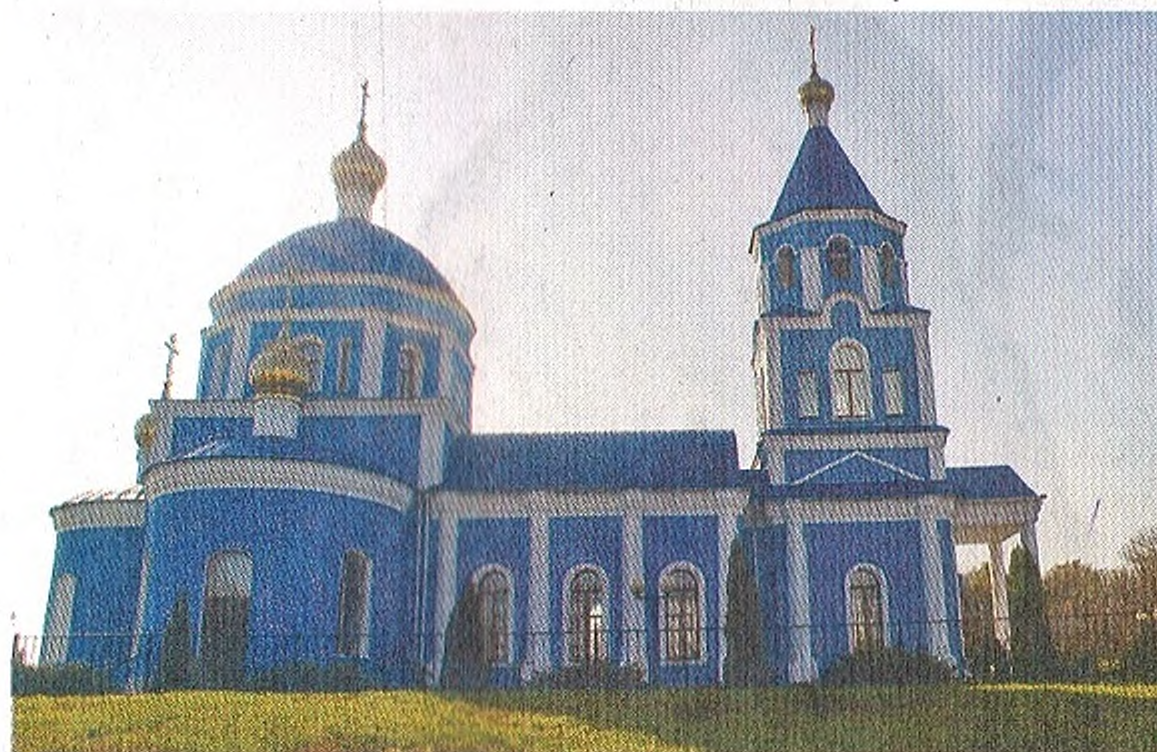
«Храм Рождества Пресвятой Богородицы построили на средства Голицына»