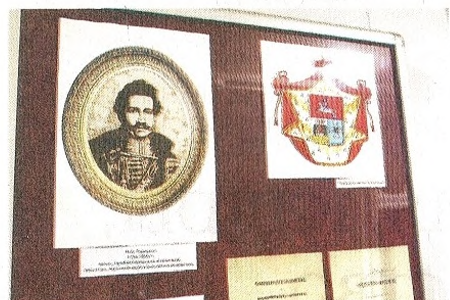
«Герб рода князей Голицыных»

— Когда наступит мир, — завершает беседу отец Алексей, — мы непременно соберём прихожан и посетим донецкий монастырь, отслужим панихиду и вспомним князя Голицына. Через него мы связаны и эту духовную связь будем поддерживать.