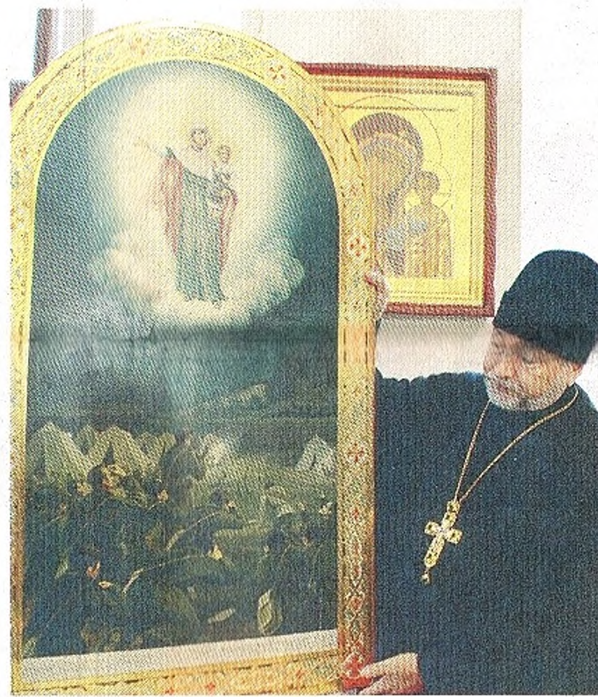
«Икона «Августовская» — явление Божией Матери русскому отряду перед поражением германцев в августовских лесах»

— Намоленность храма, самого этого места не утеряна, — говорит настоятель. — Сохраняется ощущение большого корабля с большими окнами, обилием света. Такой корабль, на котором можно спасти свою бессмертную душу.