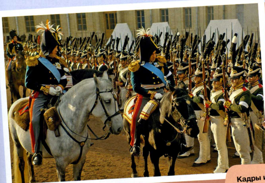
Кадры из фильма «Союз спасения»