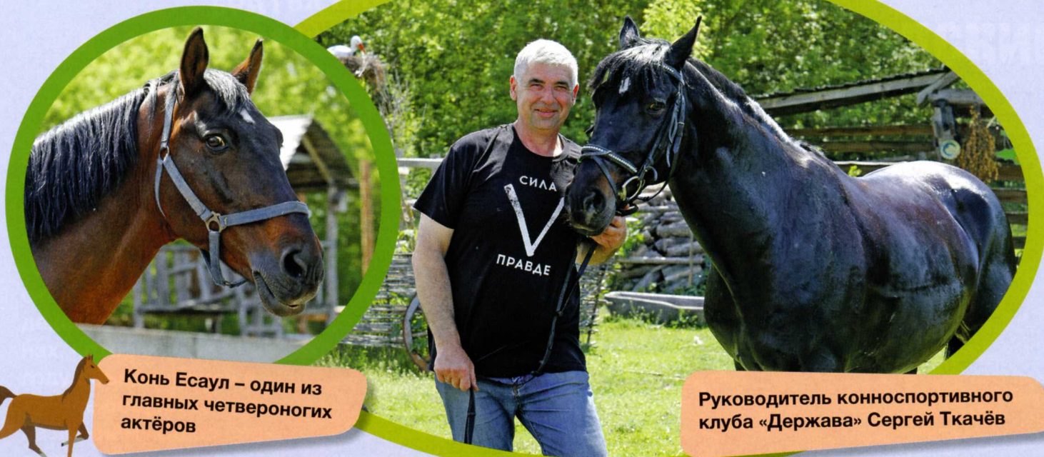
Конь Есаул – один из главных четвероногих актёров