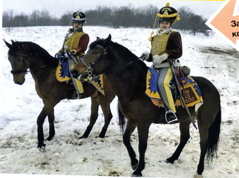
Забавка и Лирика – актёры из конноспортивной школы БелГУ