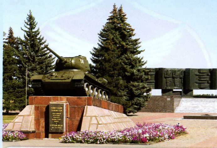
Мемориал «В честь героев Курской битвы» в Яковлевском городском округе

А в нижней части герба – лазоре-вая (то есть голубая) руда, содержащая железо. Та самая, которую здесь теперь добывают. Это главное богатство Яковлевского округа. И цвет здесь неспроста: именно на Яковлевском горно-обогатительном комбинате впервые применили удивительную технологию – замораживание руды глубоко-глубоко под землёй.