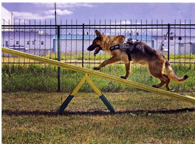
Главное – баланс

Четвероногий спасатель проводит на службе 8-12 лет. После того как служба собаки заканчивается,