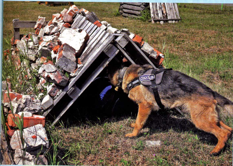
Герцог ищет людей под завалами