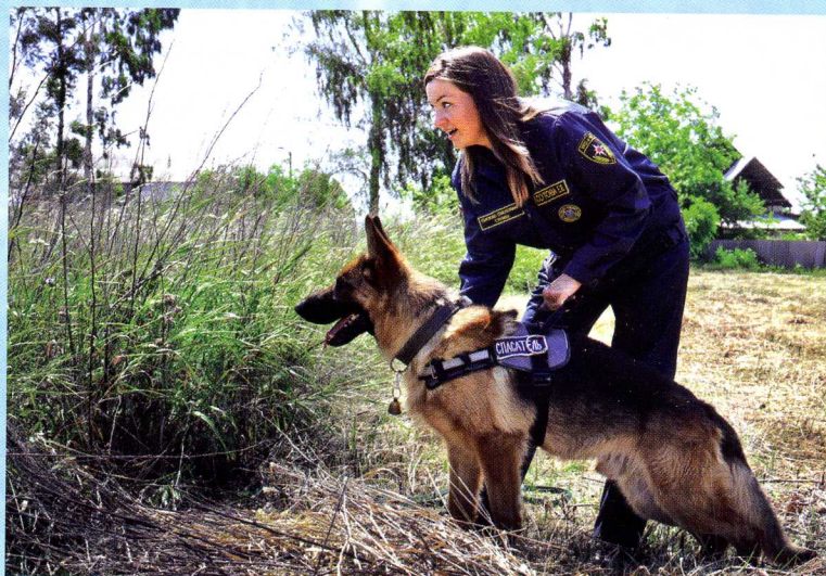
Лесная местность – не помеха для поиска

пёс чаще всего остаётся у кинолога или у сотрудников МЧС, где живёт в любви и ласке.