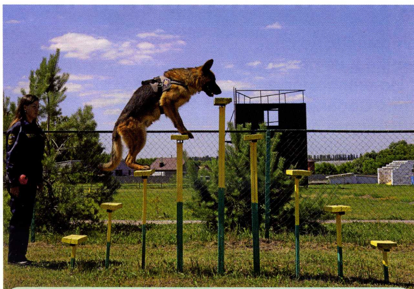
Герцог держит равновесие

Сначала в программу ежедневных тренировок входит базовая дрессировка, потом уже отрабатывается общий курс послушания. Собака учится преодолевать полосу препятствий, общаться с разными людьми (так происходит её социализация), и только после всего этого её начинают готовить к поисковой работе.