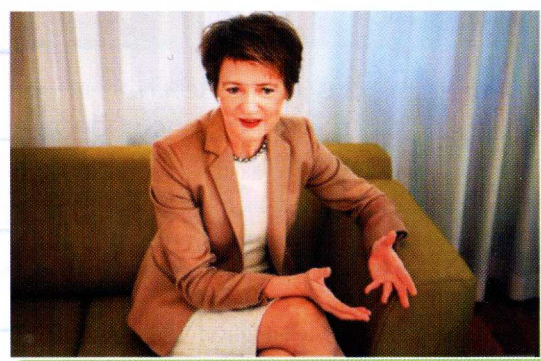
Фото Симонетты Соммаруги с автографом

Сейчас Дима учится в восьмом классе. В его коллекции есть письма от королевы Великобритании, главы католической церкви папы римского, главы Русской православной церкви патриарха Кирилла, канцлера Германии Ангелы Меркель... А в конце 2020 года коллекция пополнилась посланиями от канцлера Австрии Себастьяна Курца и президента Швейцарии Симонетты Соммаруги.