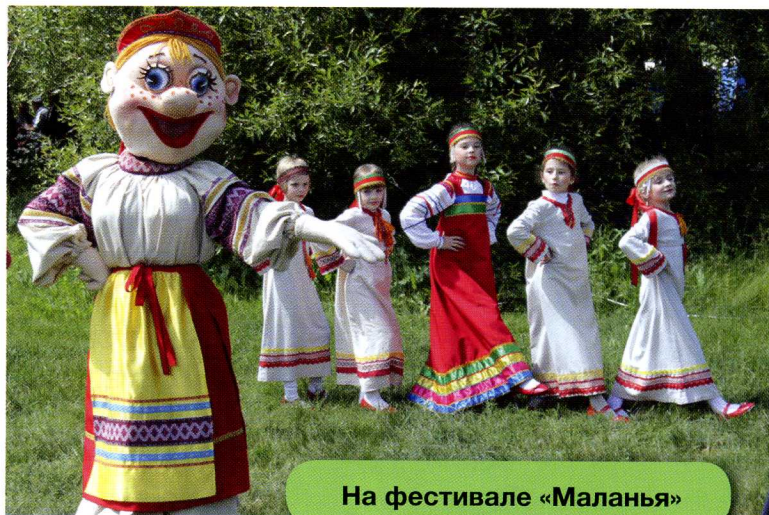
На фестивале «Маланья»

А ещё зелёный щит на прохоровском гербе как будто опоясывают две волнистые линии. Ничего не напоминают? Ну конечно же, они извиваются, будто реки! Так оно и есть: эти линии символизируют реки Псёл и Северский Донец , которые берут начало именно здесь, в Прохоровском районе. Псёл впадает в великую реку Днепр, которая течёт по территории Украины. А Северский Донец питает своими водами великую русскую реку Дон.