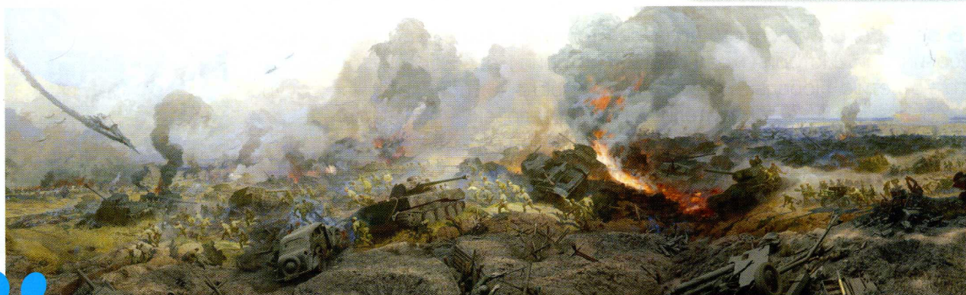
Фрагмент главного полотна диорамы «Огненная дуга. Белгородское направление» (г. Белгород)