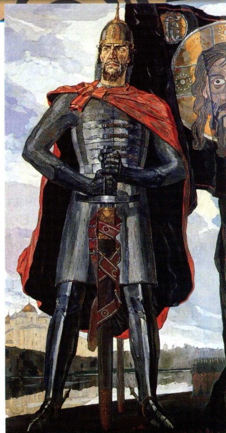
Фрагмент триптиха «Александр Невский» (1942) художника Виктора Корина (Государственная Третьяковская галерея, г. Москва)

Тысячи советских и немецких танков (а также пехота и авиация!) сошлись в смертном бою недалеко от Прохоровки . И вновь сбылись пророческие слова русского воина: «Кто с мечом к нам придёт, от меча и погибнет». Наша армия одолела в Курской битве фашистов. А затем устремилась на запад, освобождая от немецкого гнёта другие страны и народы.