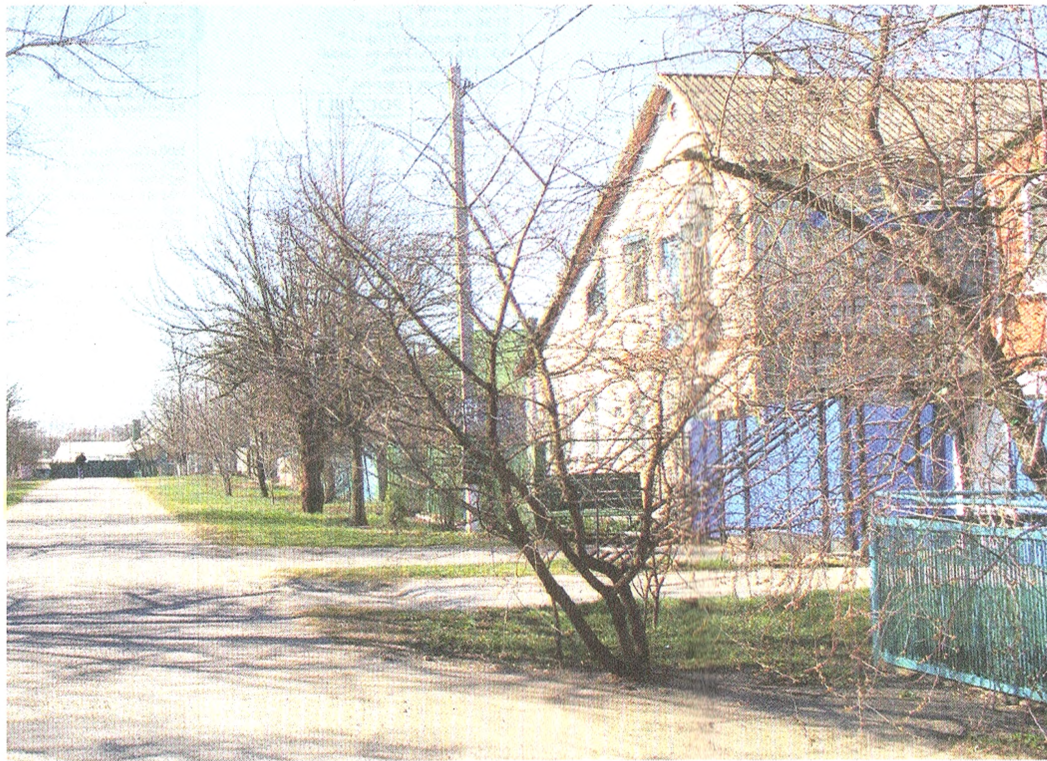
◀ В самом начале улицы стоит памятник с портретом Героя Советского Союза, лётчика-истребителя Николая Даниленко

Даниленко — это маленькая уютная сельская улочка с частными домами, палисадниками, цветущими деревьями, где вальяжно ходят упитанные коты и выбегают собаки, для профилактики погавкивая на чужаков — сторожат.