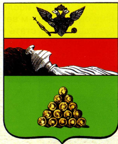
Герб уездного города Валуйки 1781 года