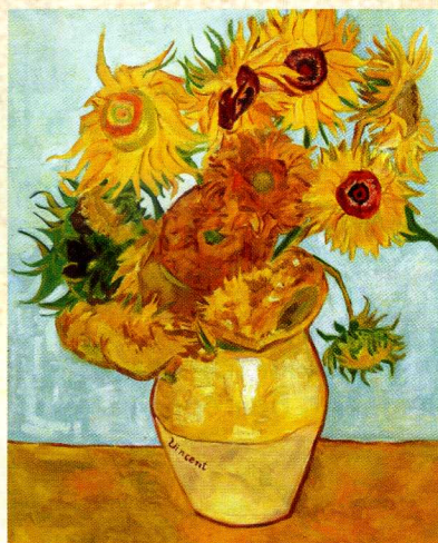
«Подсолнухи» Винсент Ван Гог

Местное масло прославилось слободу на всю Российскую империю. И даже на весь мир: вскоре алексеевский продукт стали продавать за границу. У жителей Алексеевки, которые прежде жили не слишком богато, благодаря маслу появились деньги. Они стали строить красивые каменные дома, купеческие лавки, ремесленные мастерские.