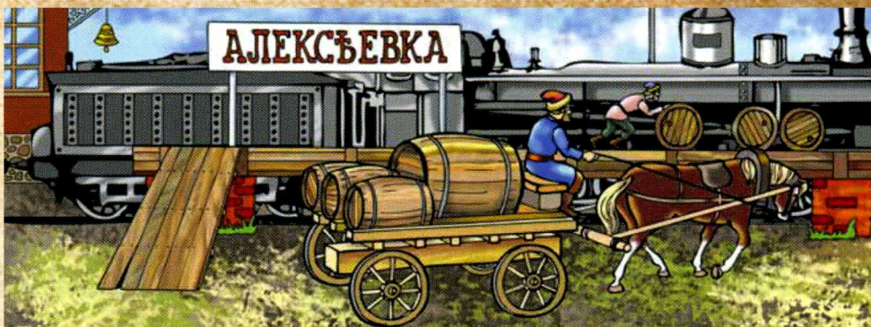
Рисунок Станислава ЧЕРНЯЕВА

Так в 1829 году Алексеевка стала родиной подсолнечного масла. Вскоре здесь появился маслодельный завод. Потом ещё один. И ещё. И ещё. А через 30 лет в уезде, в состав которого тогда входила Алексеевка, насчитывалось больше 150 заводов.