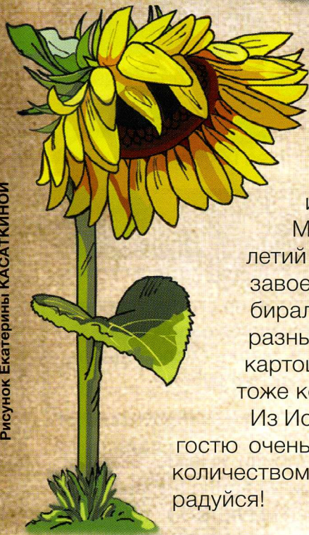
Рисунок Екатерины КАСАТКИНОЙ

Н одсолнечник все знают. Это большой красивый цветок, внешне напоминающий солнышко. А ещё это вкусный продукт. Кто из нас не любит лузгать семечки из созревшего подсолнуха или хрустеть сладкими козинаками?