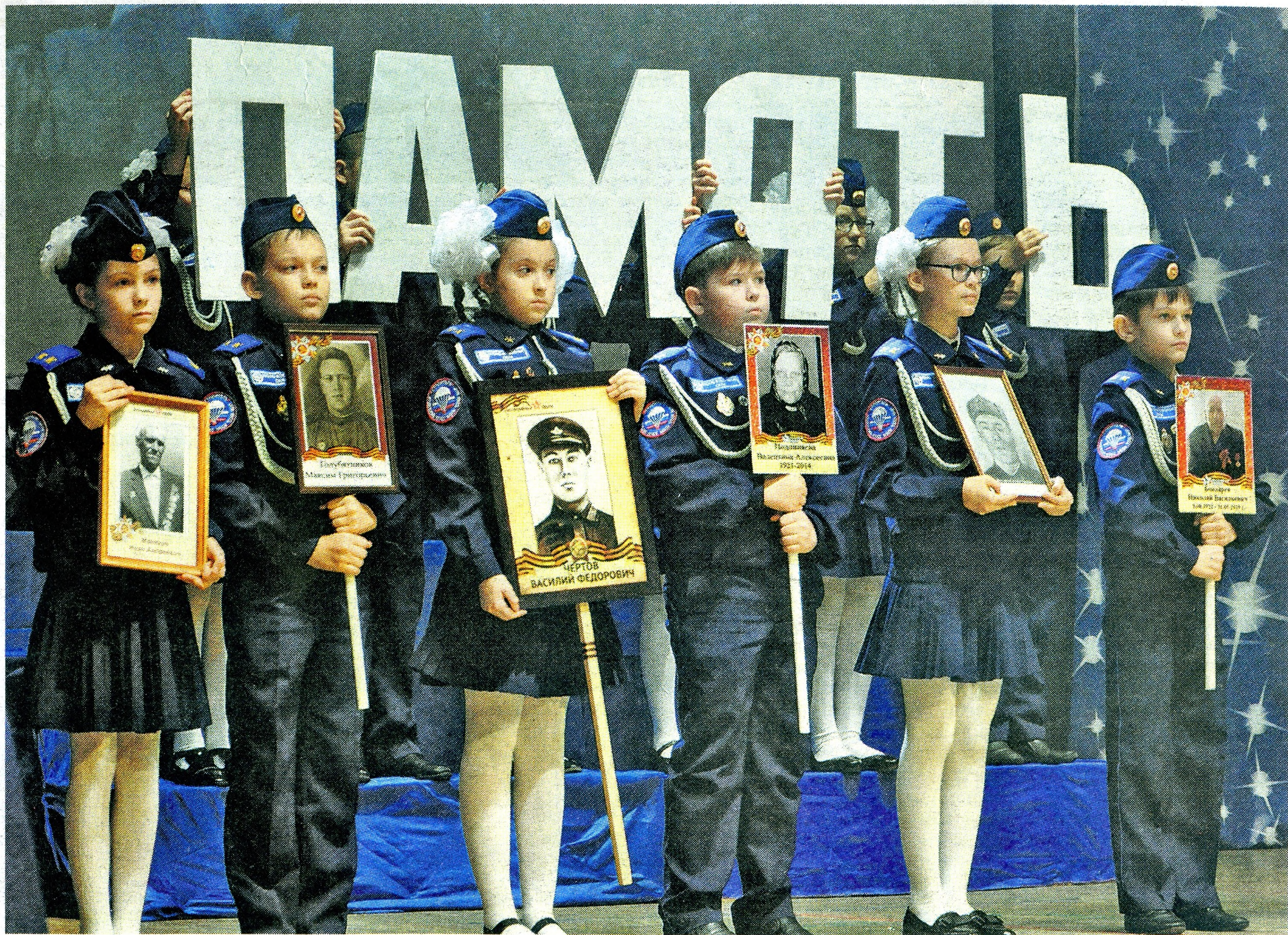
На смену Году 65-летия Белгородской области приходит Год Памяти и Славы.