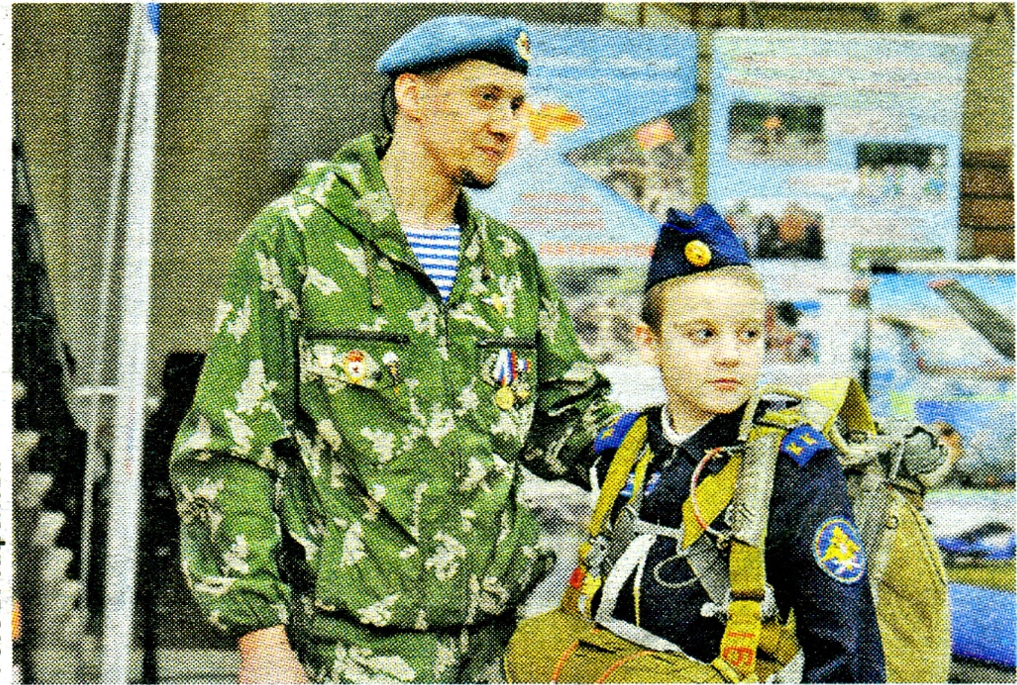
Не обошлось без выставки достижений наших местных энтузиастов