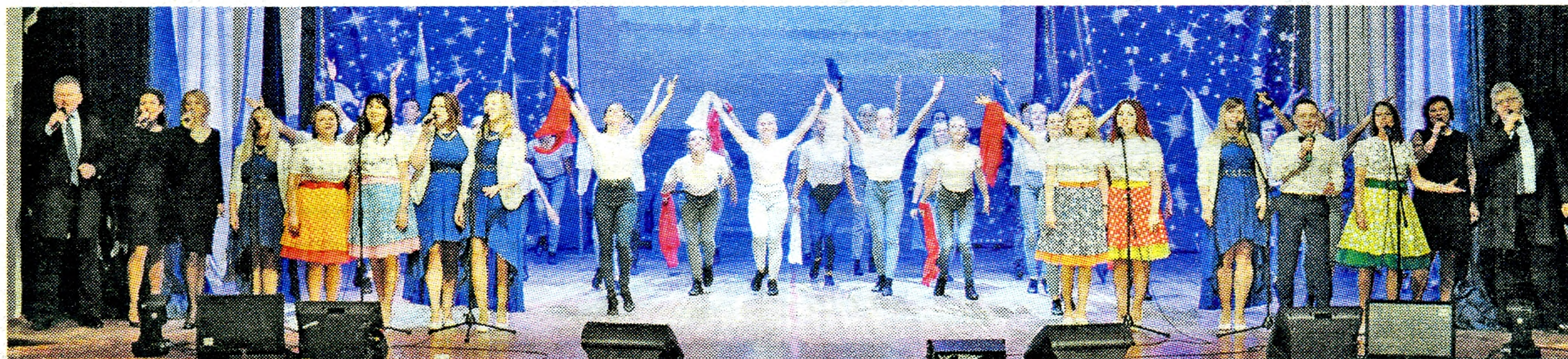
Кульминационная нота праздничного вечера