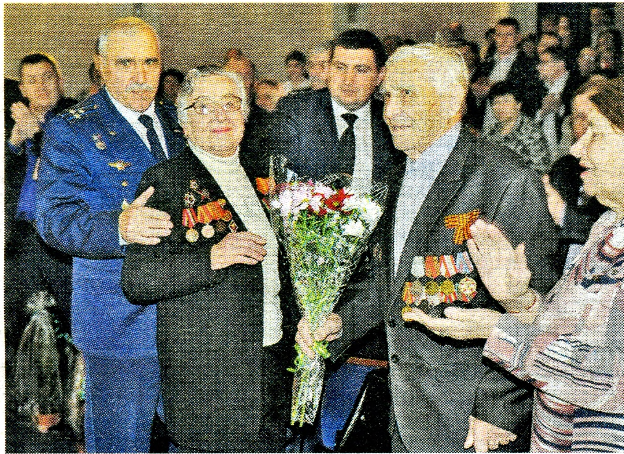
Почёт и уважение – ветеранам

Весь вечер свои лучшие номера собравшимся дарили вокальные и хореографические коллективы ЯРМДК «Звёздный». Каждый номер был наполнен чувством гордости и любви к родному краю.