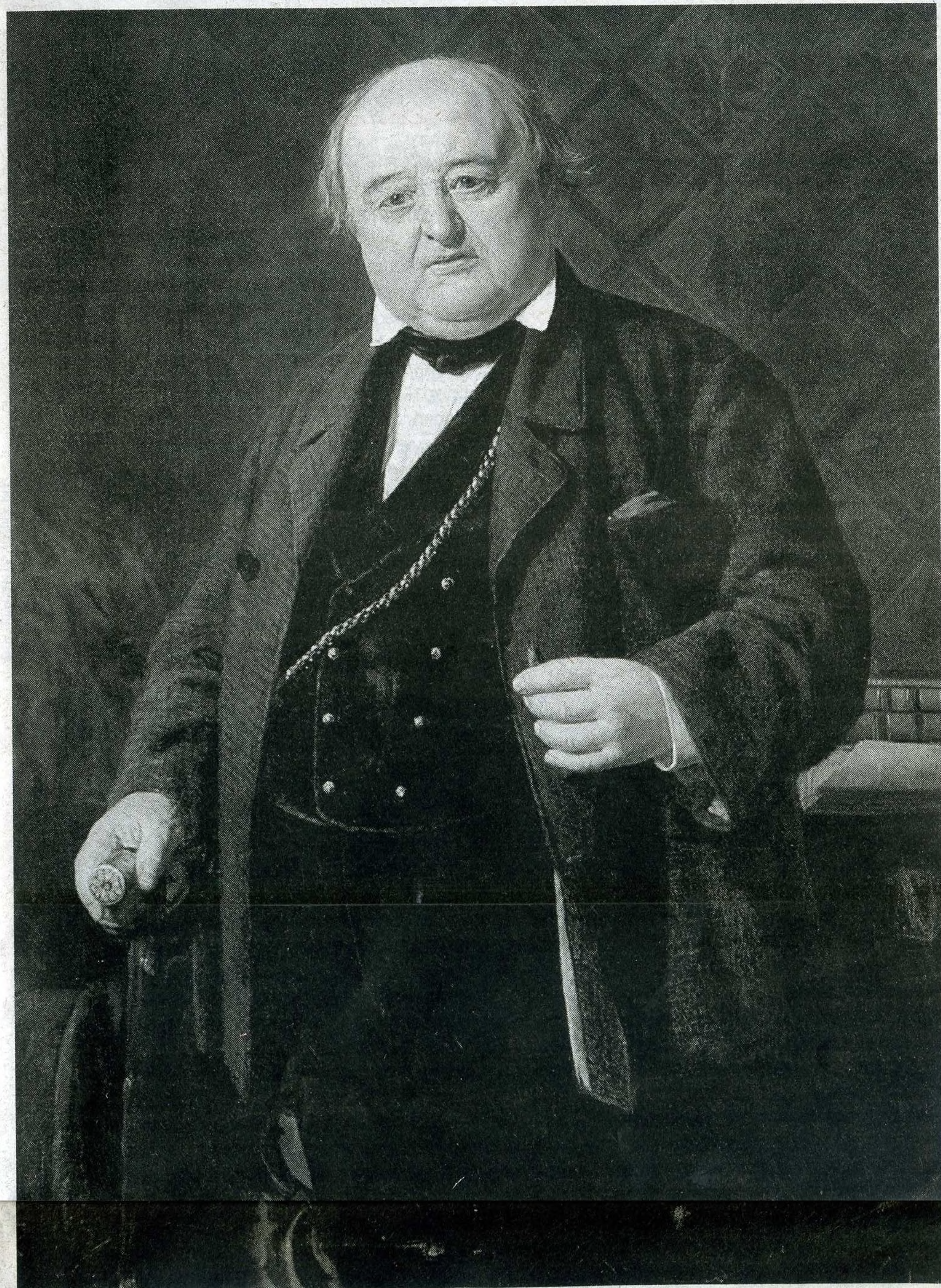
Николай Неврев. Портрет М.С. Щепкина, 1862 год

Имя Щепкина носят Высшее театральное училище при Государственном академическом Малом театре, Белгородский государственный академический драматический театр, Сумской театр драмы и музыкальной комедии. Великому актёру установлены памятники, в его честь названы улицы в Москве, Белгороде, Старом Осколе, Курске, Судже и Сумах. БП