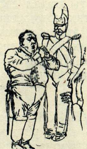
М. С. Щепкин в роли Городничего в комедии Н. В. Гоголя «Ревизор». Немая сцена. С рисунка 1840-х годов.