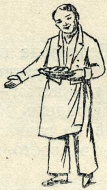
М. С. Щепкин в роли повара Суфле. С литографии 1825 г.

«Записки актера Щепкина» помогают нам сегодня узнать о важнейших событиях его жизни, прикоснуться к душевному миру замечательного самородка, блистательного артиста XIX века, видеть его глазами то далекое время, в которое он жил и властвовал на сцене.