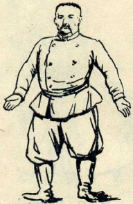
М. С. Щепкин в роли Чупруна С литографии 1845 г.

Освобождение от черного рабства совпало с другим знаменательным событием: М. С. Щепкина приглашают в Москву. 20 сентября 1822 года он дебютировал на сцене Малого театра. Пройдут годы, и день этот театроведы назовут «началом новой эры», а Малый театр получит имя «Дома Щепкина».