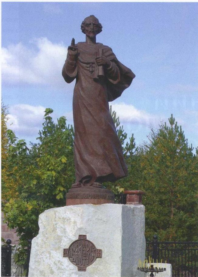
Памятник святителю Иоанну Златоусту в г. Златоусте. Художник и скульптор В.П. Жариков