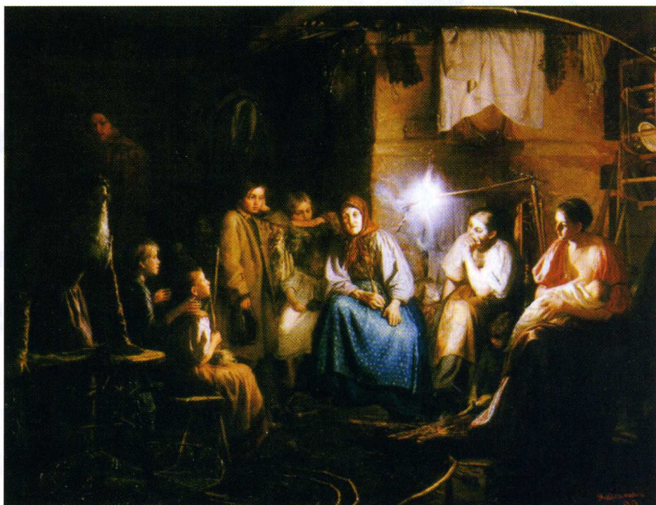
«Бабушкины сказки». В.М. Максимов. 1867г.

Основная масса языков этой семьи сосредоточена в финно-угорской ветви, правда, большинство из них относится к категории умирающих. Удмуртский – второй государственный язык Удмуртской Республики. Его алфавит дополнен пятью буквами, имеющими сверху две точки, как у буквы «ё». Марийский язык (вернее, два марийских языка –