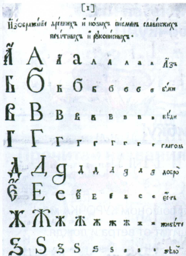
Первый лист гражданской азбуки 1710 года, утверждённой Петром I.

С 2011 года в нашей стране президентским указом установлен День русского языка. Он празднуется ежегодно 6 июня, в день рождения великого русского поэта, основоположника современного русского литературного языка А. С. Пушкина.