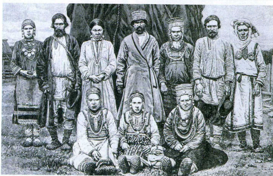
Чуваши в окрестностях Цивильска.

ники, способен не только лингвист, но и любой человек, говорящий хотя бы на одном из них. Каким образом? Да очень просто: звучание речи каждого из них покажется ему знакомым, просто немного переименованным. Ведь все эти языки относятся к славянской группе индоевропейской языковой семьи и отличаются большой степенью близости друг к другу. Эта близость объясняется происхождением этих языков от одного общего корня (их можно назвать двоюродными братьями) и длительными активными контактами, ведь говорящие на них люди живут не просто в соседних странах, а зачастую вместе, вперемешку. Примеры близких лексических соответствий, приведены в таблице, – сразу понятно, что это по сути своей одни и те же слова,