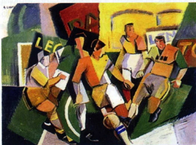
Андре Лот. «Футболисты» (1918)

Для многих художников эта динамичная и увлекательная игра стала источником новых визуальных впечатлений: энергию футболиста пытались передать авангардисты Умберто Боччони , Андре Лот и Робер Делоне .