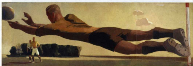
Александр Дейнека. «Вратарь» (1934)

ко работ. Художник очень любил спорт, сам увлекался боксом и борьбой.