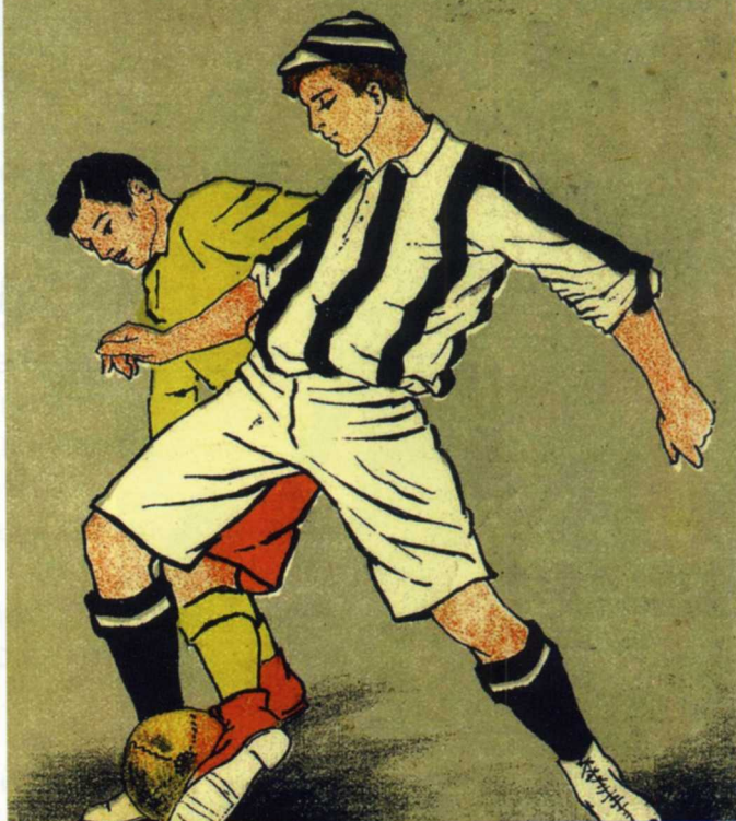
Плакат Доменико Дуранте (1903)