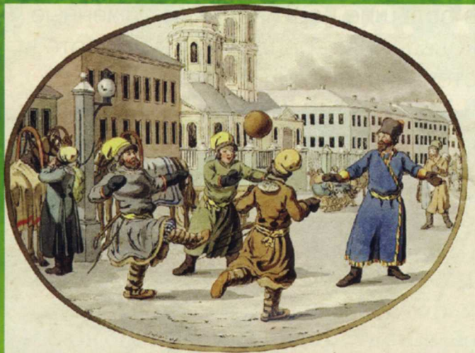
Игра в мяч на Руси Гравюра Христиана Гейслера, конец XVIII века

В общем, история футбола богата и интересна. Менялись правила игры, количество игроков в команде, форма, разметка поля и т. д. Лишь в начале XIX века футбол стал похож на тот, который мы знаем сейчас. Были придуманы единые правила и создан первый в мире футбольный клуб. Где? Конечно же, в Англии!