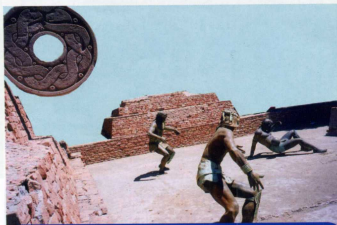
Рисунок-реконструкция игры Пок-А-Ток у древних ацтеков

в большие вертикальные каменные кольца, прикреплённые на высоте к стенам строений.