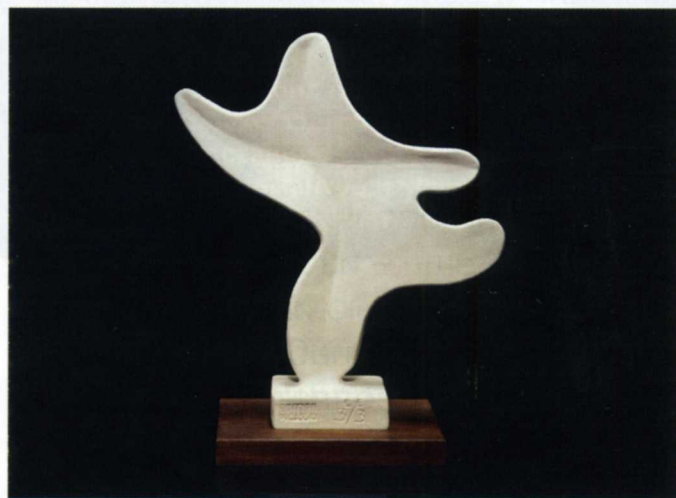
Скульптура Пабло Пикассо «Футболист» была продана одному американскому коллекционеру за 40 тысяч долларов! Пикассо – яркий представитель такого художественного течения, как авангард, где художники по-своему воспринимали и изображали реальность...

Болели за футбол и создавали произведения на эту тему величайшие художники XX века Пабло Пикассо и Сальвадор Дали . Одна из копий скульптуры Пикассо «Футболист» занимает сегодня центральное место в экспозиции Национального музея футбола в Манчестере.