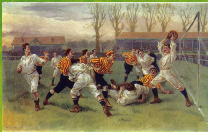
Футбол (1890) Литография Уильяма Хейсмана Оверенда

Известный советский живописец и график Александр Дейнека тоже посвятил футболу несколь-