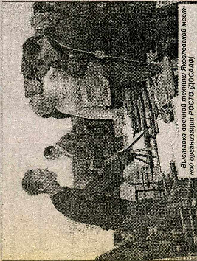
Выставка военной техники Яковлевской местной организации РОСТО (ДОСААФ)