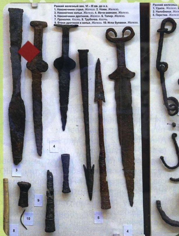
Оружие скифов, найденное во время раскопок

Красненский район – край памятников археологии. На его небольшой территории находится целых 24 памятника археологии: курганы, селища, могильники. А у села Вербное расположилась целая курганная группа. Приезжали сюда даже московские археологи и с 1964 по 1986 год проводили раскопки. Очень много предметов скифских народов (украшения, предметы быта, оружие) нашли они тогда. Теперь эти уникальные находки с многовековой историей хранятся в московском, белгородском и красненском краеведческих музеях.