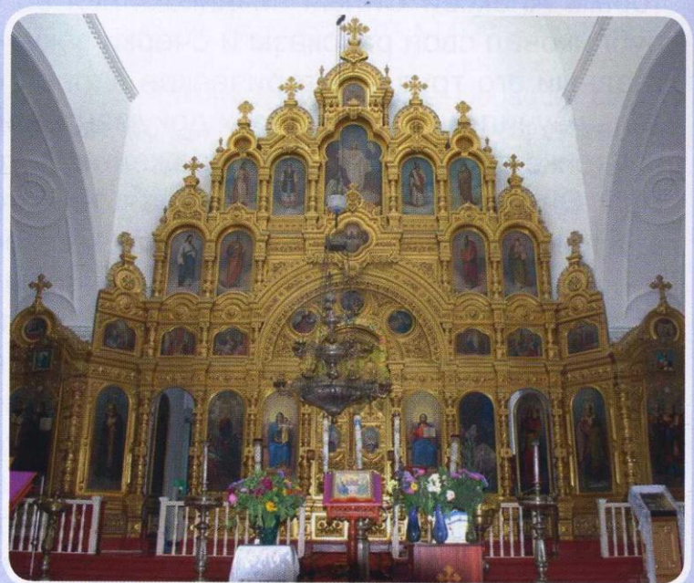
Иконостас храма в селе Лесное Уколово

На территории Красненского района, в селе Лесное Уколово, расположен уникальный не только в нашем регионе, но в России, храм Рождества Христова. Иконостас главного алтаря – пятиярусный и позолоченный. Вырезан он из липы. Говорят, изготовили его на Афоне. По преданию, несколько месяцев его везли на лошадях, а потом уже собирали в селе. Храм этот старинный: начали строить его в 1830-е годы.