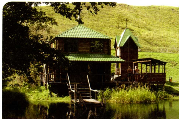
Святой источник «Криница»

А село Шопино, известное в округе своим святым источником «Криница», связано с графом Шереметевым. В XIX веке местные земли и сам родник были его собственностью. Крестьяне графа частенько купались в этих водах. Да неспроста: поговаривали, что вода в нём целительная. Со временем даже Шереметев с семьёй, наслушавшись отзывов о целебных свойствах воды, последовал примеру своих крепостных.