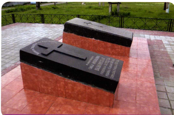
Могильные плиты князей Волконских

История яковлевских земель связана с именами известных князей и государей. К примеру, в селе Сабынино располагалось имение князей Волконских. Только бывали они в нём наездами, ведь проживали в Москве и Петербурге. Но и про сабынинское имение не забывали. Говорят, наведывался сюда даже сам Николай I. Правда или нет, доподлинно неизвестно, но якобы в водах местного ручья он крестил своих детей.