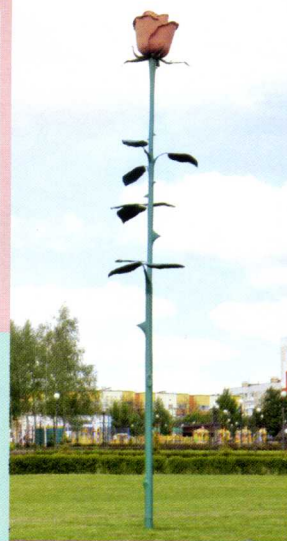
Кованая восьмиметровая роза в Парке роз

Третья железорудная «столица» нашей области – ещё и край роз. Розы, конечно, можно повстречать в каждом районе региона, но в Строителе – целый парк этих цветочков. В нём растёт более 630 кустов роз, причём разных сортов. А ещё здесь величественно возвышается кованая восьмиметровая роза. Бывают же такие!