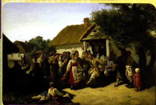
«Хоровод в Курской губернии» (1860 г.) Картина Константина Трутовского