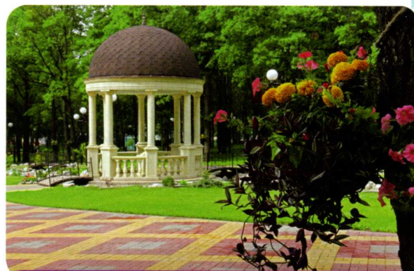
Парк «Маршалково» в г. Строителе

«Столица» Яковлевского района – Строитель – один из самых молодых городов нашей области. «Родился» он 18 февраля 1958 года. В этот морозный зимний день на заснеженном кукурузном поле забили колышек его первостроители. Рабочий посёлок с говорящим названием стал городом горняков, которые осваивали уникальное Яковлевское железорудное месторождение. Правда, статус города посёлку присвоили только в 2000 году.