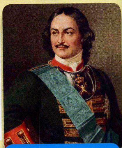
Портрет Петра I. Поль Деларош (1838)

История Старого Оскола связана с именем самого Петра Великого. Есть свидетельства, что царь бывал в здешних краях в 1703 году. Правда, проездом. Известный историк Николай Полевой в своём исследовании писал: «Узнав, что в крае возделывают коноплю для пеньки и ткнут отменный холст из одного материала, царь решил, что Старый Оскол – то место, где можно вить канаты и шить паруса для кораблей Азовской флотилии».