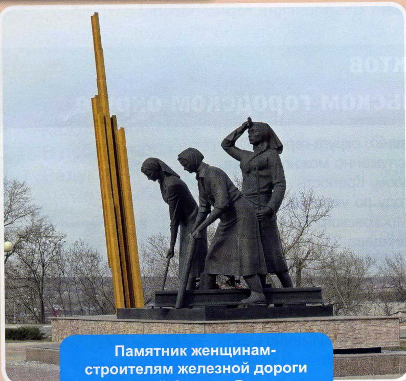
Памятник женщинам-строителям железной дороги Старый Оскол – Ржава

Старооскольский городской округ – родина героев и тружеников тыла: 23 уроженца города и района удостоены высшей награды – звания Героя Советского Союза. А за мужество, стойкость и массовый героизм, проявленные защитниками города в борьбе за свободу и независимость Отечества, Старому Осколу в 2011 году присвоили почётное звание «Город воинской славы». Немудрено. Вспомнить хотя бы строительство железной дороги Старый Оскол – Ржава. В рекордно короткие сроки (вместо запланированных двух месяцев всего за 32 дня – с 15 июня по 15 июля 1943 года) наши земляки проложили железнодорожную ветвь длиной 95 километров. Новый железнодорожный участок сыграл большую роль в победе на Курской дуге, ведь по нему смогли доставлять нашей армии боеприпасы.