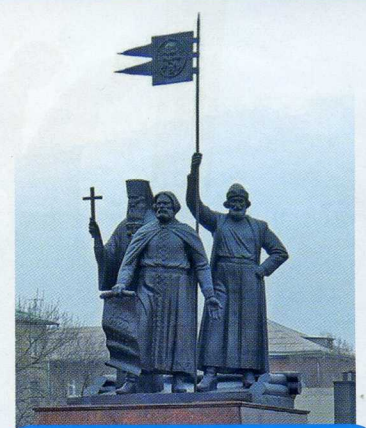
Памятник основателям города