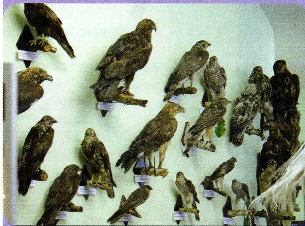
В Музее природы