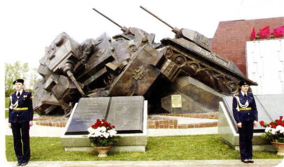
Скульптура «Танковый таран»