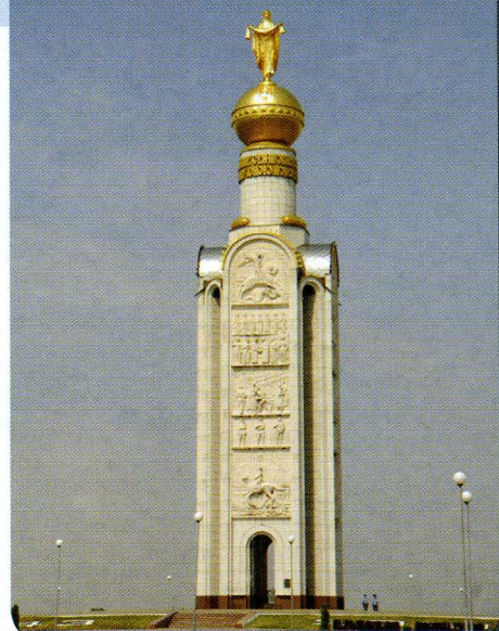
Памятник Победы «Звонница»

Победы «Звонница». Устремлённую к небу 59-метровую «белокаменную свечу» над полем славы (как окрестили её в народе) открыли в мае 1995 года. Освятил её сам патриарх Московский и всея Руси Алексий II. Четыре белораморных пилон (границы, стороны) Звонницы олицетворяют 4 года войны, а выточенные на пилонх горельефы рассказывают о героизме и вере защитников Отечества. Каждая деталь – символ: золотая сфера, над которой возвышается скульптура заступницы и защитницы России – Покрова Пресвятой Богородицы, – символ солнца, исторический символ Русской державы; лавровый венок – все павшие на поле битвы. Под сферой сияют слова из Священного Писания: «Больше сея любви никтоже имать, да кто душу свою положит за други своя», что со старославянского означает: «Нет большей любви той, как положить жизнь за друзей своих». Удивительная деталь – набатный колокол. Он звонит три раза в час. Что совсем неслучайно: первый звон раздаётся о героях Куликовского поля, второй – о солдатах Бородинского, ну а третий, как вы успели догадаться, – в память о героях поля Прохоровского.