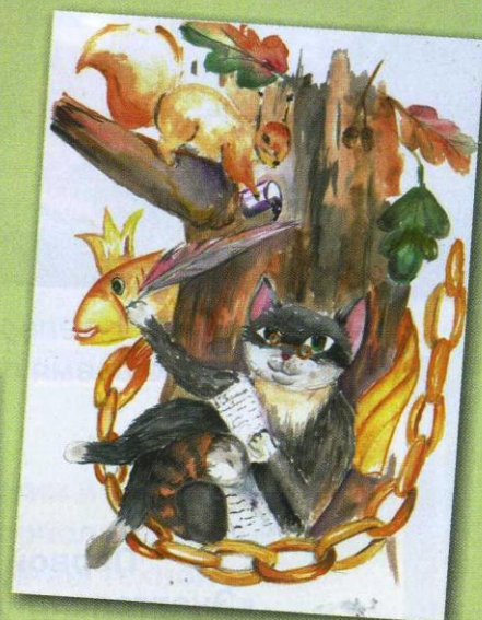
Рисунок Анжелики КРЫНИНОЙ