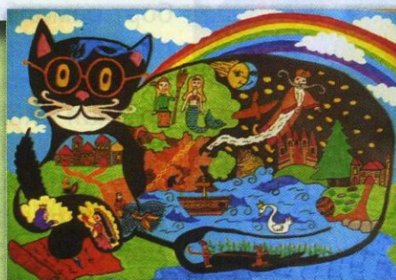
Рисунок Марии КОРОПЛЯСОВОЙ