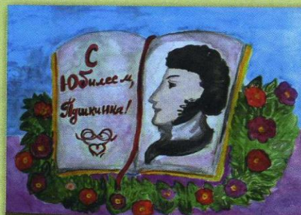
Рисунок Елизаветы РУДОВОЙ