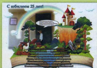
Фотоколлаж Кузьмы СЫРОМЯССКОГО