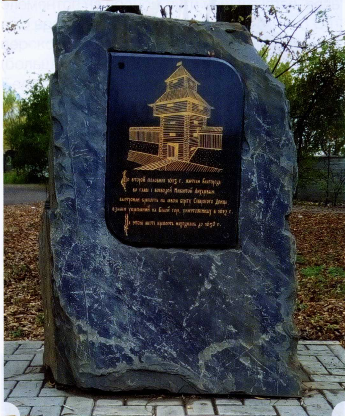
В 2016 году памятный камень установили на 2-м Корочанском переулке – на месте строительства второй Белгородской крепости