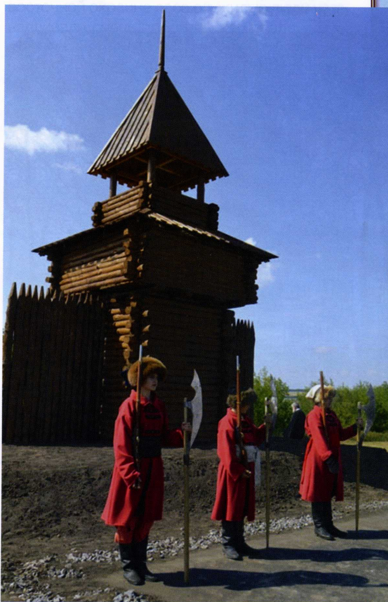
Памятный знак «Засечная черта» в селе Яковлевка Новооскольского городского округа

В августе 2017 года памятный знак «Засечная черта» установили и вблизи села Яковлевка Новооскольского городского округа. Сторожевую башню с чаштоколом возвели в месте, где сохранился участок Черты протяжённостью 800 метров. Почётный караул во время церемонии открытия и освящения несли воспитанники военно-исторического клуба «Засечная черта».