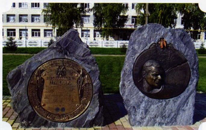
Памятный знак в селе Верхососна Красногвардейского района

При въезде в село Верхососна Красногвардейского района (бывший город-крепость Верхососенск) гостей встречает указательный знак, напоминающий об уникальной истории села: «15 августа 1647 года по указу царя Алексея Михайловича был основан город-крепость Верхососенск, ныне с. Верхососна». В селе сохранились остатки древнего леса. Вековые деревья были в те годы непроходимым заслоном для татар. На восточной окраине леса служилые люди устанавливали очень простенькие металлургические горны (печи для выплавки, переглавки и нагрева металлов), которые снабжали город-крепость металлом для военных нужд. Говорят, уже в наши дни в лесу, недалеко от села, находили куски шлака. В Верхососне сохранился ещё и фрагмент бывшего вала.