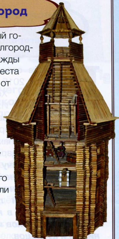
Макет Московской башни второй крепости Белгород установлен в Пушкинской библиотеке-музее. Его изготовил мастер Станислав Осипов.

Б елгород – главный город-крепость Белгородской черты – дважды переносили с одного места на другое. Неподалёку от северной границы третьей крепости в Белгороде, на проспекте Славы, построили ресторан «Башня». Он немного похож на одну из башен крепости. А вот остатки крепостного вала можно увидеть, если идти вниз от проспекта Славы в сторону Гражданского проспекта.