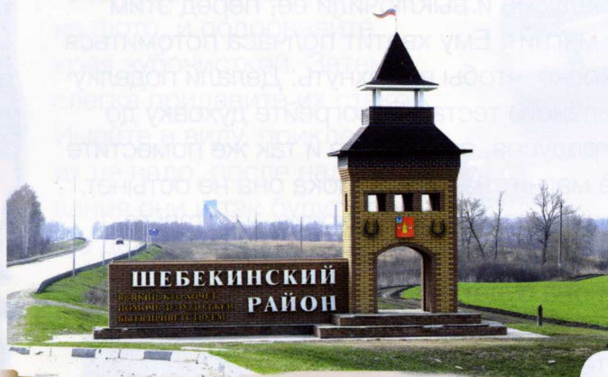
Въездной знак на границе Шебекинского городского округа и Белгородского района

Гостей и туристов, въезжающих или покидающих Шебекинский городской округ (на границе с Белгородским районом), встречает въездной знак, выполненный в форме сторожевой башни. Башенка прописалась и на гербе округа – она символизирует ратные подвиги русских воинов по защите южных рубежей Русского государства. На территории Шебекинского округа проходил Нежегольский участок Белгородской черты.