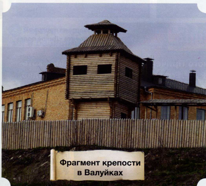
Фрагмент крепости в Валуйках

От южного форпоста Руси, старинного сооружения – Валуйской крепости, – сохранился только крепостной вал, на месте которого в наши дни построили Центр культурного развития. В центре Валоек реконструировали часть крепости (всю воссоздать не получилось из-за прилегающих зданий): стилизованный фрагмент защитной крепостной стены с четырьмя смотровыми башнями протянулся примерно на 300 метров.