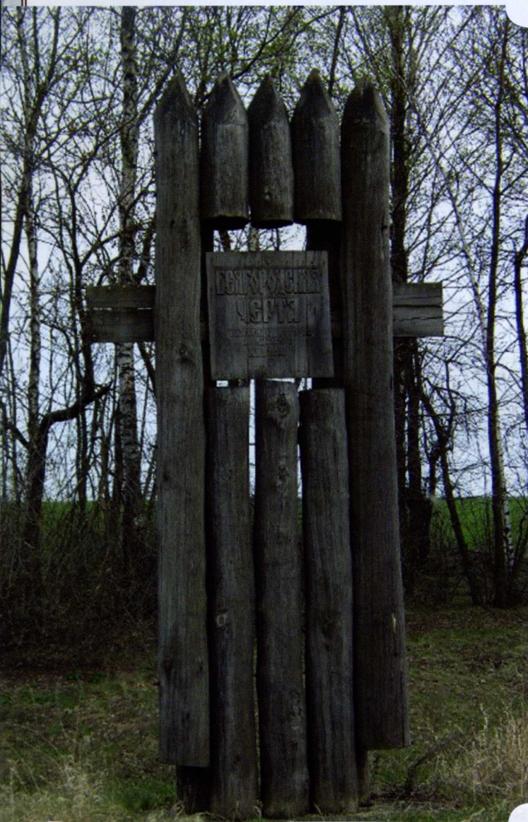
Памятный знак на месте Яблоновской крепости на территории Корочанского района

Не доезжая до села Яблоново, можно повстречать ещё один памятный знак – небольшой фрагмент деревянного частокола, на котором высечены слова «Белгородская черта».