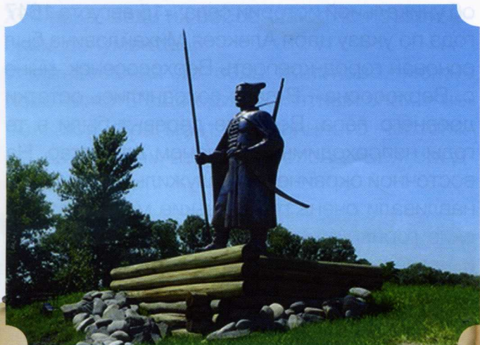
Памятник сторожевому казаку в селе Томаровка Яковлевского городского округа установили в 2015 году. Скульптор Анатолий Шишков

Н а кольцевой развязке под Томаровкой увековечили образ служилого казака, вооружённого копьём, пищалью и саблей. Здесь во времена Черты располагалось Карпово сторожевье. Его