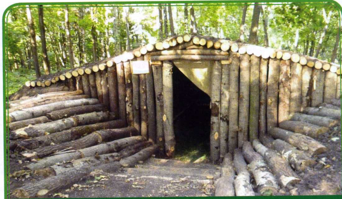
Музей под открытым небом