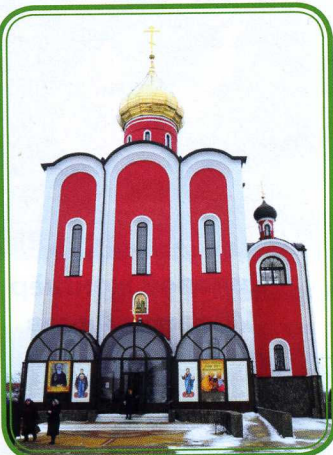
Храм Космы и Дамиана

Интересно будет посетить в Красной Яруге и храм Святых бессребреников Космы и Дамиана. Молодым его можно назвать, ведь решили его построить в 1995 году, а освятили новое строение с золотистыми куполами спустя пять лет, в 2000-м. Быстро облагородили окружающую его территорию. Рядом разбили парк, а местные жители посадили здесь дубы и декоративный кустарник.