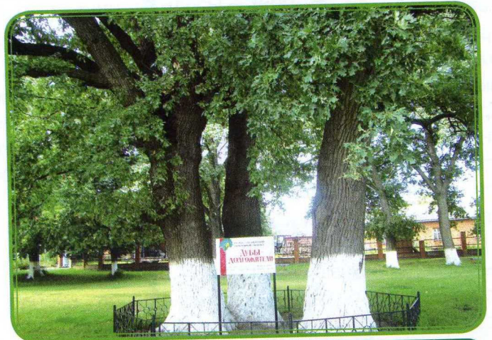
Дубы-долгожители у дома-дачи Харитоненко

Окажетесь в Красной Яруге, обязательно посетите её «сердце», если быть точным – место, где находится дом-дача Харитоненко. Построен он рядом с тремя дубами-долгожителями. Место для его строительства выбрали неслучайно. По преданию, эти деревья-долгожители – ровесники Красной Яруги. Говорят, посажены они были первыми здеш-