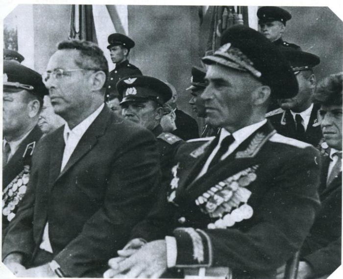
5 В августе 1968-го, когда Белгород отмечал 25-летие победы наших войск на Огненной дуге, желанными почётными гостями города стали участники Курской битвы генерал-майор Александр ЧАПАЕВ (сын легендарного героя Гражданской войны Василия Чапаева, на фото – справа) и диктор Всесоюзного радио, народный артист СССР Юрий ЛЕВИТАН (на фото – слева). Этот снимок был сделан во время праздничного митинга на городском стадионе.