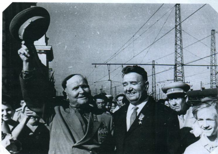
4 В 1963 году белгородцы отмечали 20-летие победы в Курской битве и освобождения родного города. Юбилейные торжества получились яркими, запоминающимися. В них приняла участие делегация Министерства обороны страны и возглавлял её Маршал Советского Союза Иван КОНЕВ (на фото – слева).