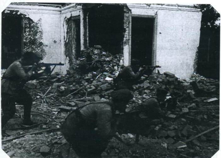
3 Пехотинцы врываются в расположение врага.