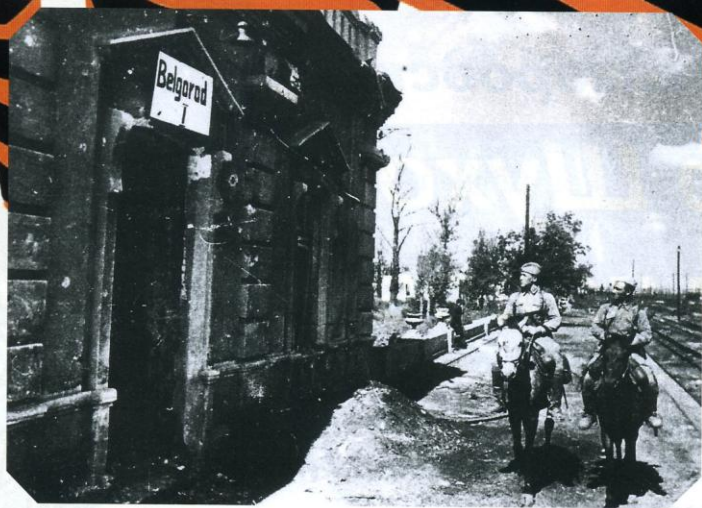
1 Август 1943 года. Конный патруль на станции Белгород.