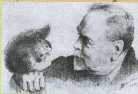
Автопортрет с белкой

И первый наш рассказ – об известном художнике-живописце Аркадии Александровиче Рылове (он родился 29 января 1870 года в Вятской губернии, ушёл из жизни в 1939 году). Его работы хранятся в Третьяковской галерее в Москве и в Русском музее Санкт-Петербурга, в музеях Калуги, Костромы, Рязани, Казани, Астрахани и других городов. На некоторых картинах художник запечатлел белгородское Поосколье – много лет подряд он приезжал в наши края, чтобы отдохнуть и понаблюдать за красотой местной природы.