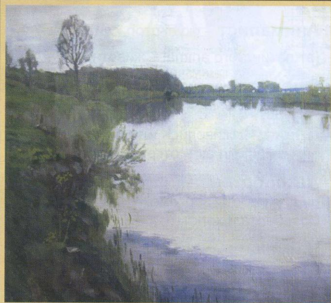
Река Оскол. Весенний мотив

Рылов очень любил животных – не случайно одна из самых известных его работ называется «Автопортрет с белкой». Он был не просто художником-анималистом, но и изучал повадки животных, их привычки и поведение; звери не боялись подходить к его избушке и даже заходить внутрь. А внутри избушки тоже были свои жильцы – обезьянка, зайцы, белки и птицы. Аркадий Рылов был очень добрым человеком: