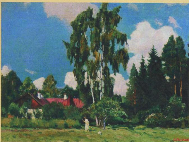
Домик с красной крышей

ещё одно окошко с видом на лесную опушку. В стене, обращённой к лесу, была сделана широкая дверь, чтобы, стоя у мольберта, я мог видеть внутренность леса и тропинку, уходившую в глубь лесную, чтобы можно было писать человека, лошадь в лесу на пленэре прямо на картину...»