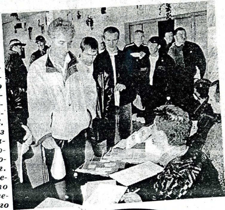
Н. ЕВГЕНЬЕВА.

то. Надеемся, что в оставшихся двух видах мы сохраним и удержим завоеванные позиции.