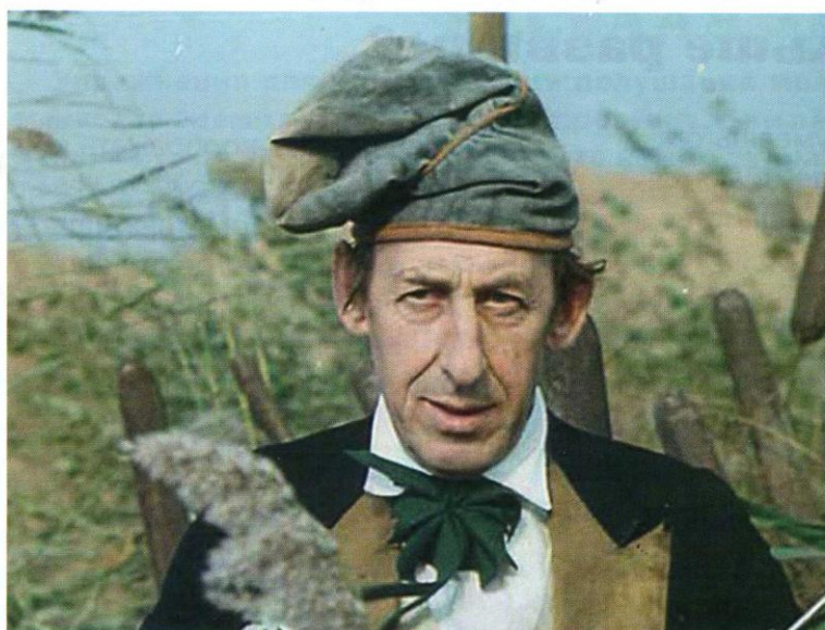
Владимир БАСОВ в роли Дуремара в «Приключениях Буратино»

В годы Великой Отечественной Басов был награждён орденом Красной Звезды и боевыми медалями.