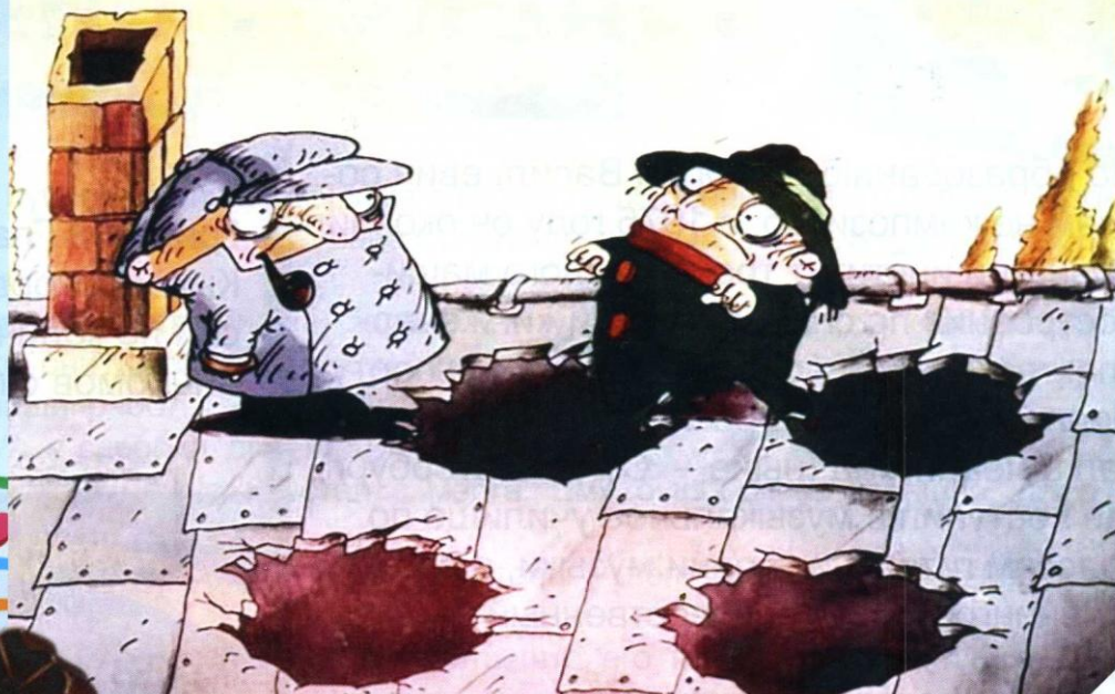
Кадр из мультфильма «Следствие ведут Колобки», музыку к которому написал Григорий ГЛАДКОВ

живописный и неповторимый пейзаж! А запахи степи – они особенные, ярко выраженные. Они напоминают мне детство.