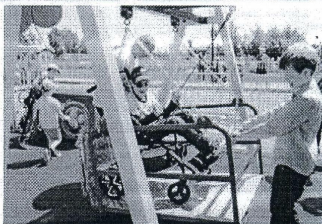
Фото по предоставлению В. Тараненко

Роман ОЖЕГОВ , при содействии пресс-службы ООО «ГК Агро-Белогорье»