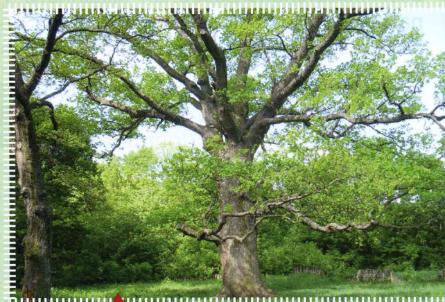
Панский дуб и... его младший брат

А вы знаете, от деревьев заряжаются энергией. Нужно прикоснуться к нему ладонями или обнять. Я не прочь проверить теорию. Интересная она. Но какое же дерево выбрать? Может, дуб? Отлично будет, если ему много-много лет, к примеру, пару веков. Где у нас растут дубы-старички? Вспомнил: в Шебекинском районе у западной окраины села Яблочково произрастает панский дуб, а ещё один – в посёлке Дубовом. Говорят, панскому долгожителю не меньше 550 лет. Согласно легенде, в 1709 году Пётр I, возвращаясь с Полтавской битвы, останавливался и отдыхал под тенью могучего дуба. А вот его младшему брату около 360 лет. Говорят, посадили его князь Григорий Ромодановский и гетман Богдан Хмельницкий в честь воссоединения России и Украины. Потому его часто так и называют: дуб Богдана Хмельницкого. Скажете, интересные истории?! Да, вот только это легенды. В 2013 году специалисты из Москвы обследовали деревья и установили их возраст: панскому великану 200 лет, а дубовскому – 184 года. Солидный возраст! Нам они точно подходят. Так что быстрее бежим заряжаться энергией и гулять на свежем воздухе.