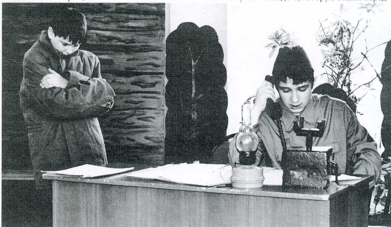
Театр книги. В. Богомолов. Иван

Несмотря на то что конкурс проходит уже шестой раз, интерес к нему у детей не снижается, и каждый год более 20 классов района принимают в нем участие. Задача, которую ставит перед