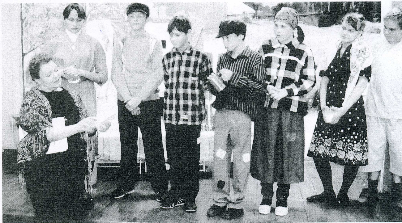
Мастер-класс с народной артисткой М.А. Русаковой

В номинации «Классный театр книги» ребята читают книги отечественных авторов: классиков XIX и XX веков, современных писателей. Подростки творчески подходят к прочтению и постановке произведений: пишут сценарий, продумывают атрибутику, костюмы, декорации, звуковое сопровождение. Работы юных актеров интересны и разнообразны, каждый старается передать чувства и характер своего героя. Своеобразный мастер-класс по театральному мастерству был проведен с участниками библиочемпионата народной артисткой России, ведущей актрисой Белгородского государственного академического драматического театра имени М.С. Щепкина