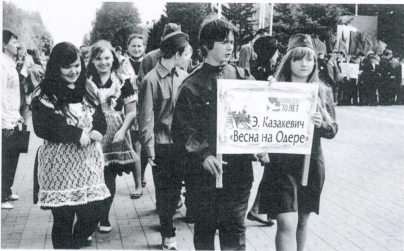
Участники фестиваля «Порохом пропахнувшие строки»

Каждый год наполнение библиочемпионата изменяется, это находит отражение