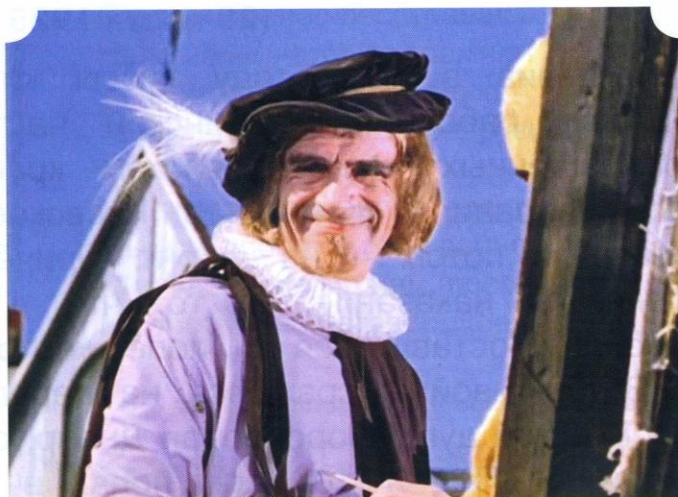
Зиновий ГЕРДТ в фильме «Город мастеров»