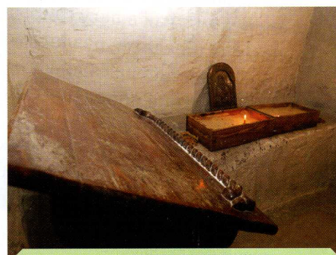
В подземном меловом храме

В 1990 году в Чернянском районе открыли возрождённые Холковские пещеры подземного монастыря . Первое летописное упоминание о монастыре датировано 1620 годом. Кельи его были выдолблены в меловых пещерах, из мела монахи вырубали и столы, и кровати. Монастырь просуществовал более 140 лет – в 1764 году императрица Екатерина II повелела его закрыть, а входы в пещеры – завалить. Восстанавливать пещеры начали в 70-е годы XX века.