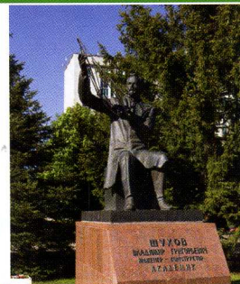
Памятник Владимиру Шухову

В 2001 году на территории Белгородской технической академии строительных материалов (так в те времена назывался БГТУ им. В. Г. Шухова) открыли памятник великому инженеру России нашему земляку Владимиру Шухову . Автор памятника – белгородский скульптор, заслуженный художник России Анатолий Шишков.