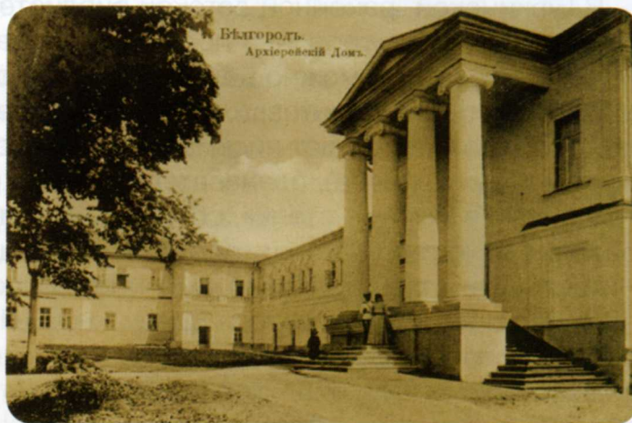
Архиерейский дом, в котором в 1924 году был открыт Белгородский музей краеведения

Поэтому после войны пришлось собирать экспозицию заново.