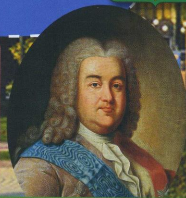
Портрет князя Алексея Черкасского работы художника Ивана Аргунова (1760-е гг.)