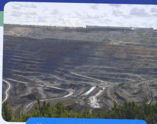
Карьер Лебединского ГОКа

Губкинский городской округ – край-рекордсмен. Работающий в Губкине Лебединский горно-обогатительный комбинат дважды занесли в Книгу рекордов Гиннесса. Спросите, что в нём такого уникального? Во-первых, предприятие разрабатывает уникальное по запасам месторождение железной руды. А во-вторых, оно имеет крупнейший в мире карьер по добыче негорючих полезных ископаемых. Так, максимальная ширина карьера Лебединского ГОКа составляет около 5 километров, глубина – порядка 600 метров.