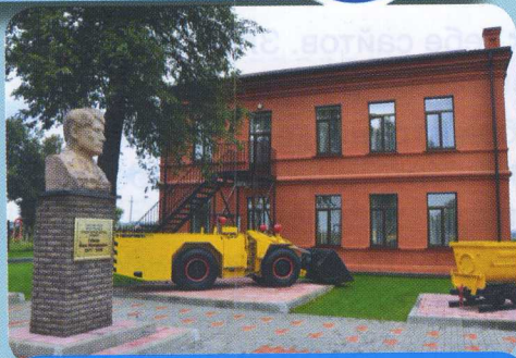
Музей истории КМА