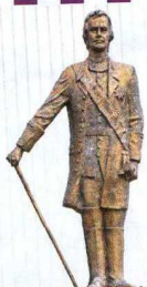
Памятник Г.Г. Волконскому, основателю посёлка

ют, в те времена по Осколу ходили суда. Но нелегко было путешествовать по реке. Из-за часто встречающихся мелей, а зачастую и крутых изгибов, суда приходилось буквально волоком перетаскивать с помощью коней. Отсюда и получаем волокни – конные, а следовательно и название – Волоконовка.