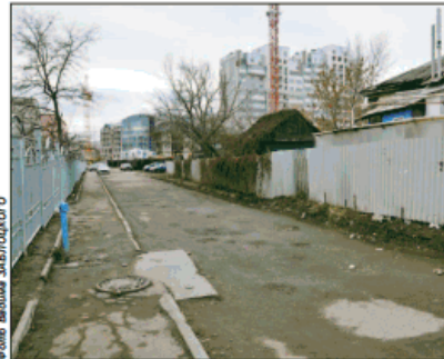
Улица Демьяна Бедного