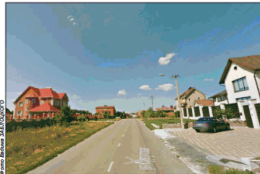
Улицу Сургутскую назвали так севернее