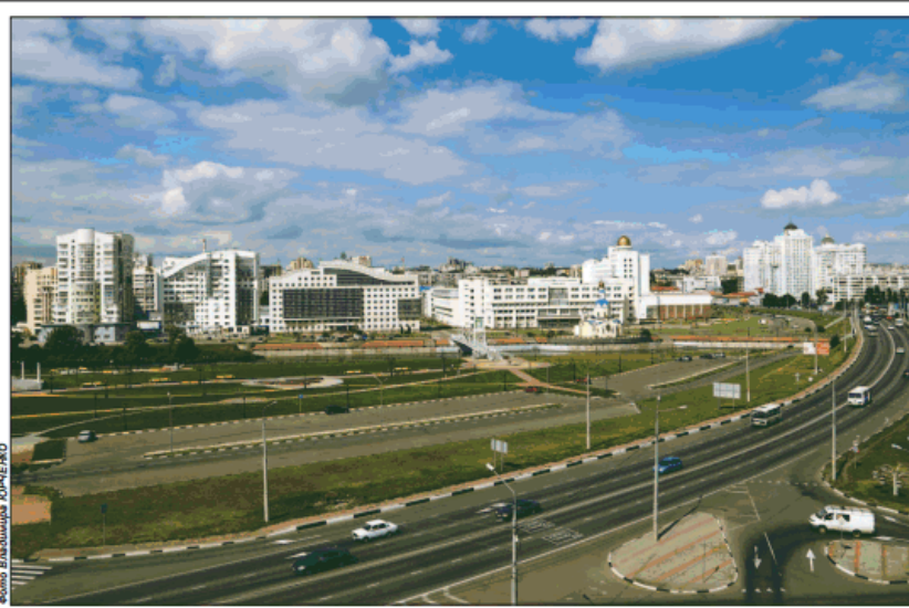
Самая длинная улица Белгорода 8,6 километра - проспект Богдана Хмельницкого (снимок сверху), а самая короткая 160 метров - улица Демьяна Бедного (снимок внизу)

Многочисленные фамилии, к примеру, есть улица Пономарёва, названная в честь красноармейца, который погиб при освобождении Белгорода. Но сегодня мы даже имени этого че-