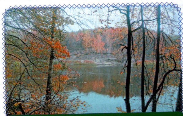
На озере Угрим

И ещё одно чудо природы – лесное озеро. Недалеко от Весёлой Лопани расположилось. Именуется Угрим. Завораживающим его называют. Ведь находится оно в центре лесной чащи. Будто маленькая капелька-сердцевинка, совсем небольшое оно. К слову, и не глубокое. Не больше четырёх метров будет его максимальная глубина. Как зачастую бывает с достопримечательными местами, существует легенда, связанная с ним. Согласно ей в незапамятные времена конокрады прятали здесь добычу от чужих глаз. Правда это или нет, проверить нельзя. Однако доподлинно известно: наверху, откуда начинался спуск к лесному озеру, когда-то стоял дом помещика. До сих пор там сохранился старинный сад.