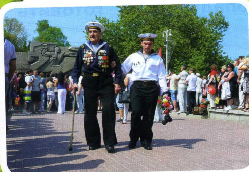
ДЕНЬ ПОБЕДЫ 9 МАЯ В СЕВАСТОПОЛЕ

Вторая оборона случилась в годы Великой Отечественной войны. В 1941 году фашисты рассчитывали взять город за несколько дней. Но на самом деле увязли тут на долгие месяцы, хотя их было намного больше, чем наших солдат, которые проявили львиную храбрость! За время второй обороны погибло более 150 тысяч советских воинов. Это очень большая цифра!