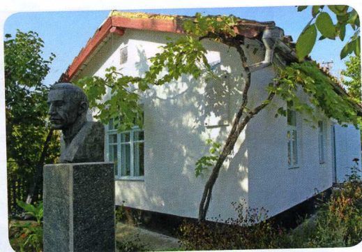
ДОМ-МУЗЕЙ АЛЕКСАНДРА ГРИНА

Столица района – город Старый Крым. Он и правда очень старый: его основали примерно 800 лет назад. В этом городе есть музей писателя Александра Грина. Много лет назад он придумал красивую сказку про девушку Ассоль, которая ждала своего принца. И принц приплыл к ней на корабле под алыми (то есть красными) парусами. Ты можешь прочитать книжку или посмотреть фильм, который так и называется – «Алые паруса».