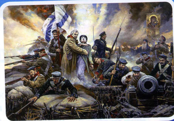
КАРИНА ВАСИЛИЯ НЕСТЕРЕНКО «ОТСТОИМ СЕВАСТОПОЛЬ!»

Первая оборона случилась больше 150 лет назад. Русская армия героически сражалась с превосходящим противником – французами и англичанами.