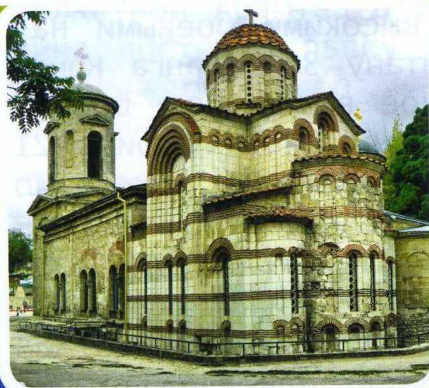
ХРАМ ИОАННА ПРЕДТЕЧИ В КЕРЧИ, СОХРАНИВШИЙСЯ СО ВРЕМЁН ТМУТАРАКАНСКОГО КНЯЖЕСТВА

Да-да, русским Крым стал очень давно. В 960 году часть Крыма вошла в русское Тмутараканское княжество (оно располагалось на месте современного города Керчь и его окрестностей). Так что и это сказочное название – вовсе не придуманное, а настоящее, историческое название древнего княжества. А управлял им брат Ярослава Мудрого, о котором вам наверняка рассказывали на уроках истории.