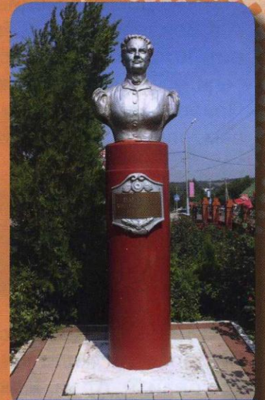
Памятник графине Софье Паниной

Уникально название столицы района – посёлка Вейделевка. Пожалуй, единственный на Белгородчине населённый пункт, происхождение названия которого имеет немецкие корни. Получила своё название Вейделевка от имени своего первого владельца – генерала русской службы Родиона Кондратьевича Вейделя. Сын немецкого барона Рудольф фон Ведель дослужился в русской армии до высокого звания генерал-майора. Но не очень близко было слуху местного населения его иноземное имя, вот и прозвали его более удобным и понятным им – Родион Кондратьевич Вейдель. Что интересно – вейделевцы считают первым историческим лицом своего края (а это подтверждает соцопрос, который провели уже в наши дни) графиню Софью Владимировну Панину. Стала она владелицей здешних земель в 1881 году. Многие сделала для развития посёлка. К примеру, построила больницу в Вейделевке. Считалась она по тем временам лучшей сельской лечебницей во всей Воронежской губернии. В память о графине установили памятник возле Вейделевского краеведческого музея.