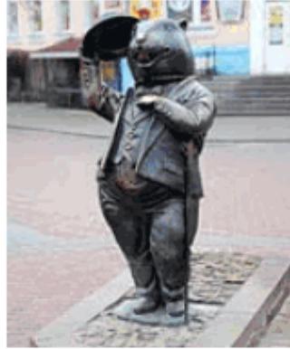
^ Памятник бобру в Бобруйске

Зубы бобров стачиваются, но на их месте вырастают новые. Вот почему у людей не так?! Передние клыки выпирают, что придаёт мордочке зверька жизнерадостное выражение. Правда, цвет клыков далёк от жемчужного — они ржаво-красные. Челюсти и щёки бобра устроены так, что и при работе в воде он не захлёбывается. Передние клыки фиксируют древесину, а нижние челюсти ходят, как пила.