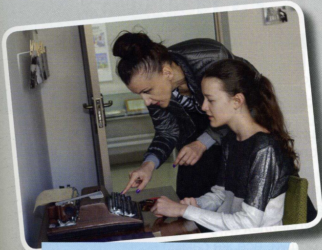
В интерактивной зоне музея журналистики