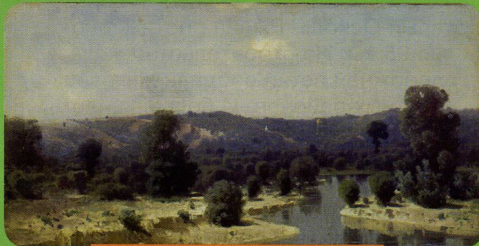
Картина Юлия Феддерса «Меловые берега»

24 июня В 1917 году в Белгороде вышел первый выпуск газеты «Воля народа», которая стала «прародителем» областной газеты «Белгородская правда». В 1917-1924 годах газета носила разные названия – «Воля народа», «Известия Белгородского Совета рабочих и солдатских депутатов», «Вестник Белгородского революционного комитета», «Красная победа», «Трудовой день», «Белгородская газета». Впервые под названием «Белгородская правда» газета вышла 12 марта 1921 года. Более двадцати журналистов «Белгородской правды» сражались на фронтах Великой Отечественной войны, шести журналистам газеты присвоено звание «Заслуженный работник культуры РФ».