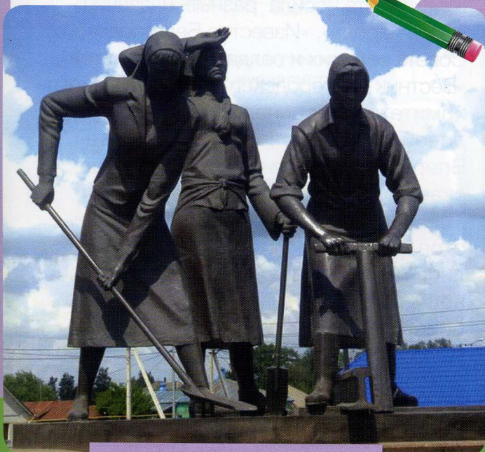
Памятник женщинам – строителям железной дороги Старый Оскол – Ржава

В 2008 году в Старом Осколе открыли памятник женщинам – строителям железной дороги Старый Оскол – Ржава (автор памятника – белгородский скульптор Анатолий Шишков).