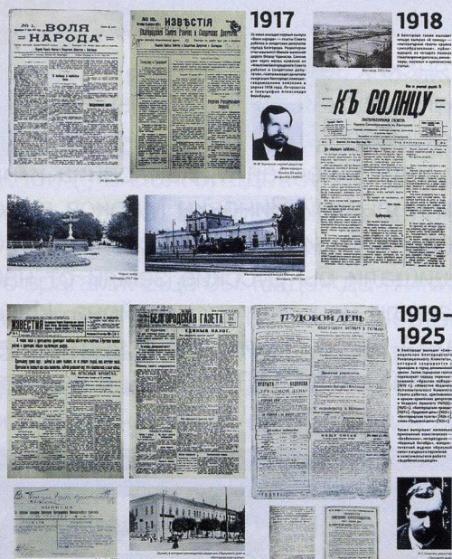
Фрагмент экспозиции музея истории белгородской журналистики