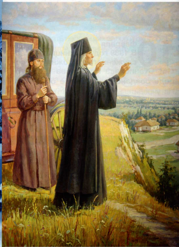
Благословение Белгорода святителем Иоасафом. Картина белгородского художника Владимира Нестеркова

28 февраля В 1991 году в Ленинграде, на чердаке музея истории религии и атеизма, обнаружены мощи епископа Белгородского и Обоянского святителя Иоасафа. Священную реликвию едва не уничтожили из-за самодурства коменданта музея, сторонника борьбы с религией. Сотрудники спрятали святыню в шлаковой засыпке на чердаке Казанского собора, где располагался музей. После второго обретения мощей белгородского святителя их перевезли в Белгород, в Преображенский собор. После того как археологи обнаружили в Белгороде место расположения пещерки святителя Иоасафа (там его останки находились более 150 лет), в 2011 году там построили новую усыпальницу и часовню, а мощи святителя перенесли в обновлённую пещерку.