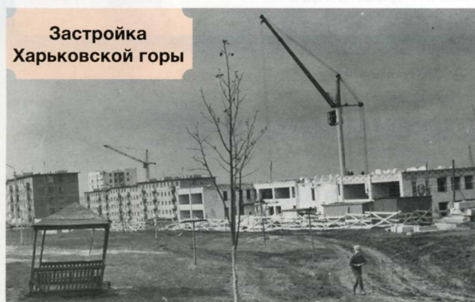
Застройка Харьковской горы

В Белгородском градостроительном совете составили план застройки Харьковской горы. Тебе это сейчас трудно представить – но 50 лет назад на месте этого огромного и хорошо развитого микрорайона Белгорода был просто пустырь!